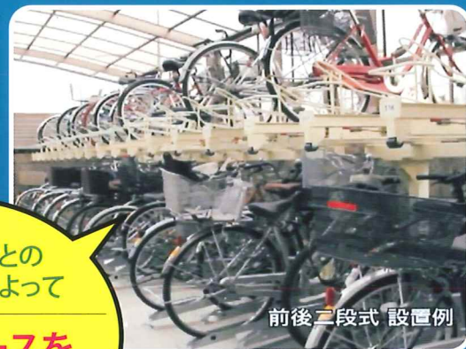
前後二段式 設置例